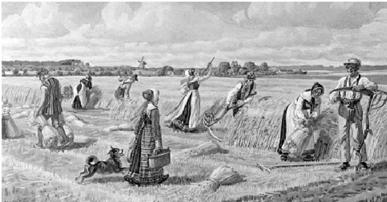
På arbejdet i hovmarken – malet af R. Christiansen i 1929