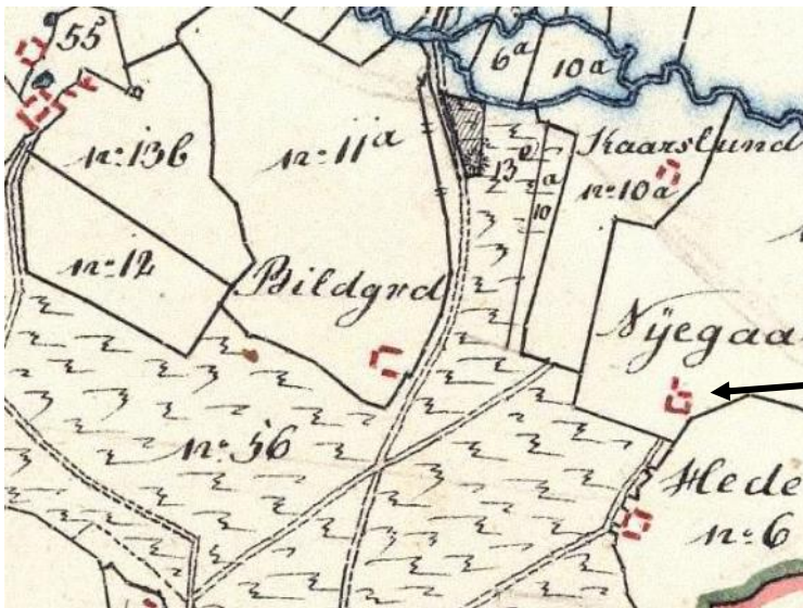
Her er et matrikeltkort over den første matrikel fra 1844

I parentesen står der 13-1016 det betyder at vi skal have fat i Skøde- og Panteprotokollen der har nr. 13 og her skal vi slå op på side 1016 der er så en afskrift af skødet på ejendommen. Det viser sig at de ikke er på side 1016 men på 1016B.